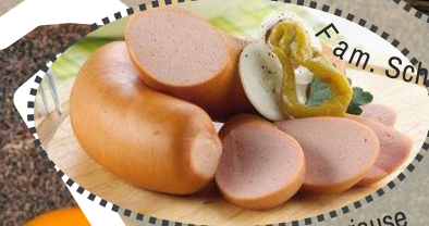
Knackerjause Fam. Schiffelhuber, Schache &