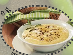
"Brotzeit" Fam. Krausgruber Parz