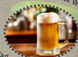
Bier Mechtels Imbissstube