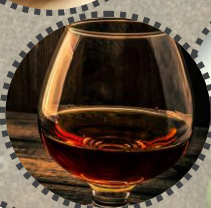
Cognac Fam. Schoberleitner, Wee &