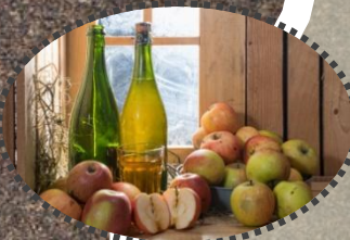
Most Seminarhof Schleglber &