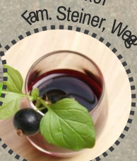
Likör Fam. Steiner, Wegg