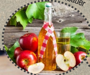
Most Fam. Heftberger Schneiderbauer