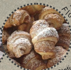
Vorletzte Station Fam. Stumpfl/Schiemer, Winklin & Würstl & Abschluss 1. Tag Fam. Wallberger, Rottenbach