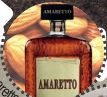
Amaretto Flör Resi & Lois