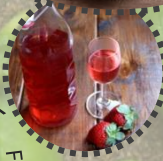
Likör Fam. Hehenberger