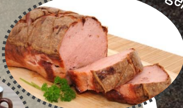
Fam. Wallberger Watzing Leberkäse