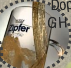
Labstation Fam. Pint & Pöttinger & Kern