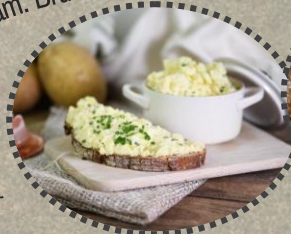
Abschlussjause Fam. Bruckmüller, Winkling