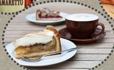
Kaffee & Kuchen Flör Steffi u. Sepp