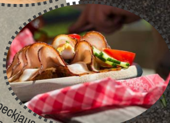
Speckjause Fam. Voraberger, Wöböck Watzing &